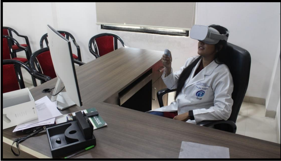
Virtual laboratory photos (Use of VR by students)