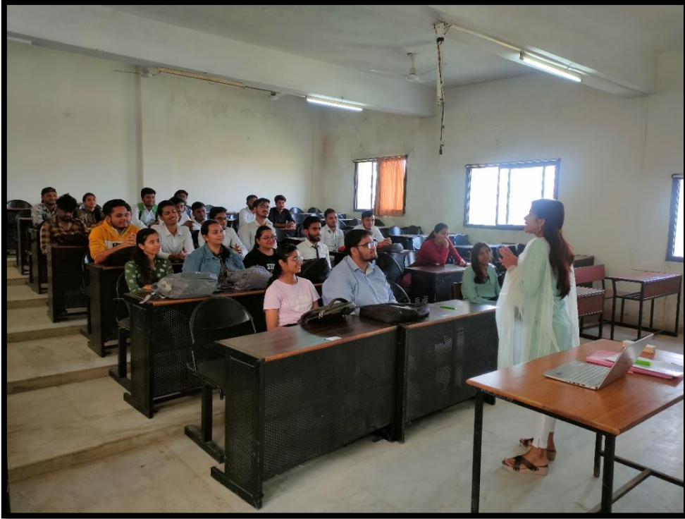
Peer Teaching and Mentoring Session for Competitive Exams